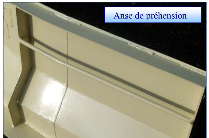
Anse de préhension